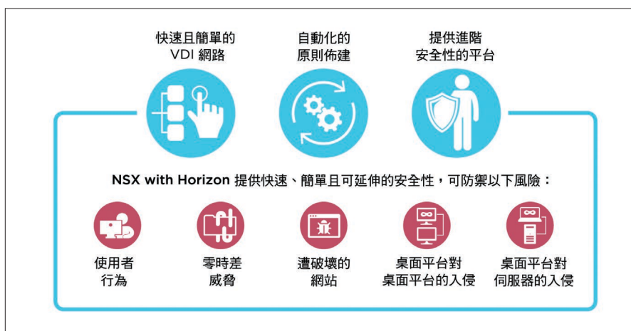
圖 5. VMware NSX with Horizon

透過 VMware vSphere® 運用並擴充您的專業，輕鬆提供桌面平台和應用程式工作負載。Horizon 7 利用虛擬運算、虛擬儲存與虛擬網路與安全防護擴充了虛擬化的強大功能，以持續降低成本、提升使用者經驗，並提供更大的商業靈活性。