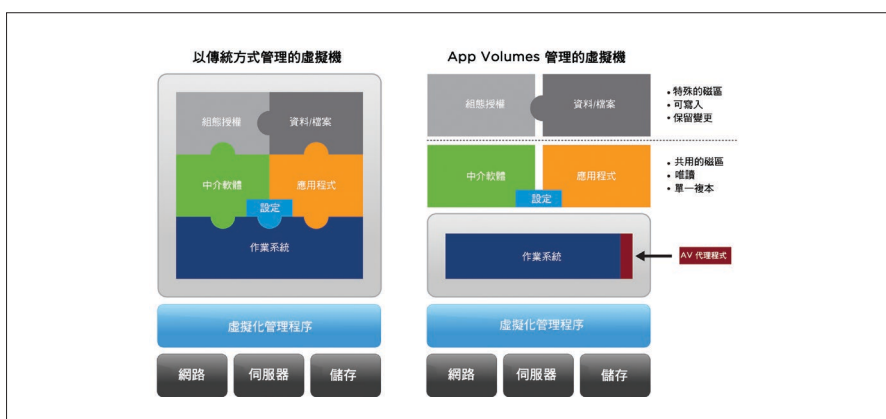
圖 4. 在作業系統層級上方，嵌入採用 App Volumes 管理的虛擬機；應用程式、資料檔案、設定、中介軟體與組態設定授權，都當做個別層級來運作。