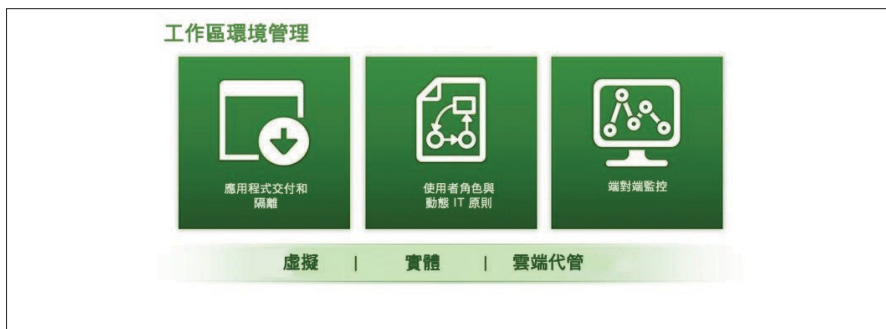
圖 3. Horizon 7 提供完整的工作區環境管理

Horizon 7 確保 IT 可透過單一緊密整合的平台來整合使用者運算資源的控制、自動化交付與保護作業。